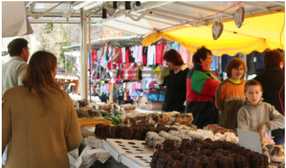
Frühlingshafte Temperaturen und traumhaftes Wetter gab es diesmal beim traditionellen Kirtag.